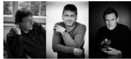
Beat Haldimann Artisanat-création