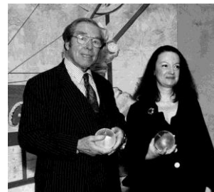
George Daniels Artisanat-création