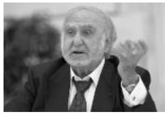
Nicolas Hayek Esprit d'entreprise