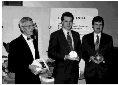
François-Paul Journe Artisanat-création