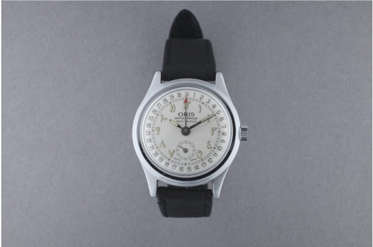
Montre-bracelet Oris avec quantième, destinée au marché arabe, collection privée