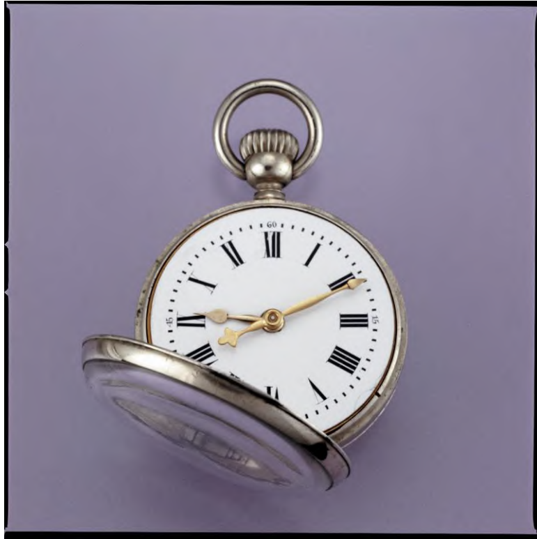
La montre dite "la Prolétaire", G.-F. Roskopf, La Chaux-de-Fonds, vers 1867, collection MIH, Inv. I-375