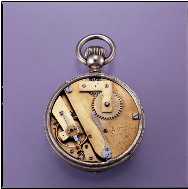
La montre dite "la Prolétaire", G.-F. Roskopf, La Chaux-de-Fonds, vers 1867, collection MIH, Inv. I-375