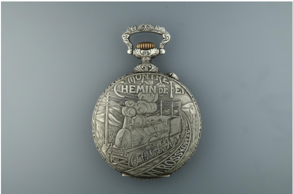
Montre de chemin de fer W. Roskopf & Cie (C. Meyer-Graber, La Chaux-de-Fonds). Collection privée