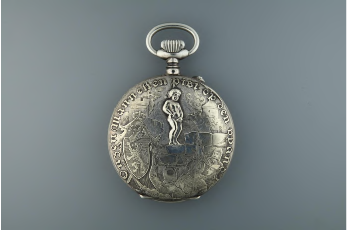
Montre de poche ornée sur le fond d'une représentation du Manneken-Pis. La lunette porte l'inscription "Au plus ancien Bourgeois de Bruxelles". Cadran signé F.E. Roskopf Patent 18639 Genève. Collection privée