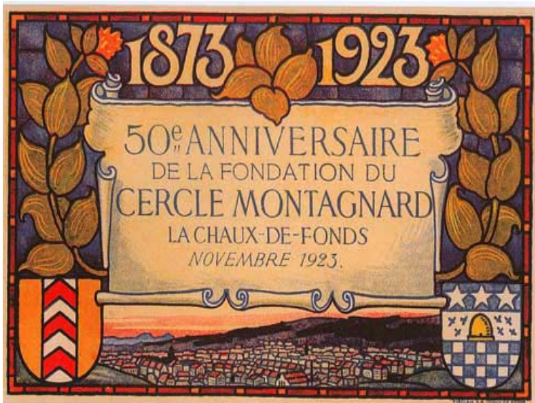
Bristol du 50 e anniversaire du Cercle montagnard, fief des libéraux et sis au 17 de la rue Daniel-JeanRichard. Ses membres rejoignirent le Cercle du Sapin, en juin 1938.

Pour le Cercle du Sapin, il y avait déjà la concurrence libérale du Cercle Montagnard puis intervient la création du Parti progressiste national (PPN) en 1920 ou 18, qui fait disparaître radicaux et libéraux du district du Locle. A La Chaux-de-Fonds, le PPN s'affermi, mais les deux autres partis subsistent. Le besoin d'union se fait plus présent. Le Cercle Montagnard se ferme en 1938 et 43 de ses membres rejoignent le Cercle du Sapin. C'est ainsi que le Cercle du Sapin n'est plus le fief des seuls radicaux et qu'il devient le point de rencontre des membres des trois partis nationaux.