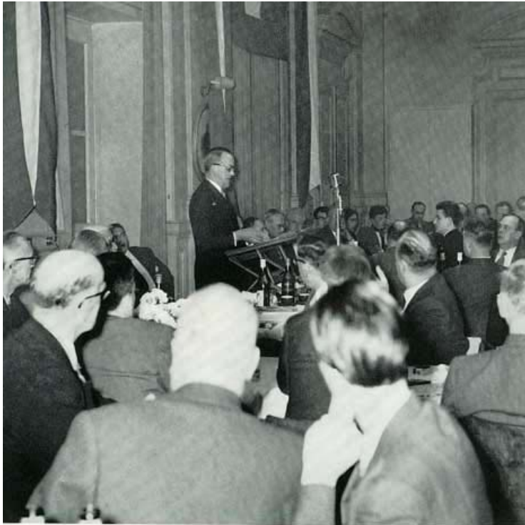
1 er Mars 1937 Discours de M. Max Petitpierre, Conseiller fédéral

Le Cercle du Sapin est non seulement l'une des plus anciennes sociétés du canton de Neuchâtel, mais il est devenu, durant l'espace de 60 ans , une société prestigieuse où s'est forgé l'avenir de la République. Cette République, qui, un an avant la création du Cercle du Sapin, avait été mise en danger par une rébellion royaliste.