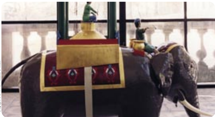
Clepsydre d'Ibn al-Razzâz al Jazari

Mise en valeur de pièces réalisées par des étrangers ou destinées à être exportées, admirées en parcourant les expositions permanentes.